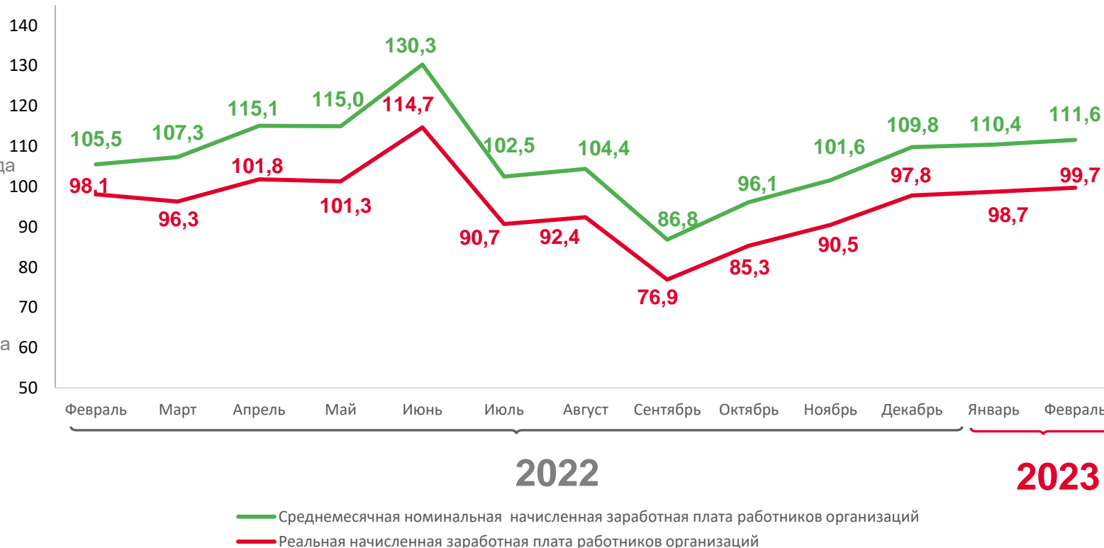
Среднемесячная номинальная и реальная начисленная заработная плата работников организаций, в % к соответствующему месяцу предыдущего года

реальная начисленная заработная плата работников организаций в феврале 2023 года к февралю 2022 года